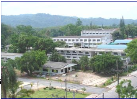
การจัดการ