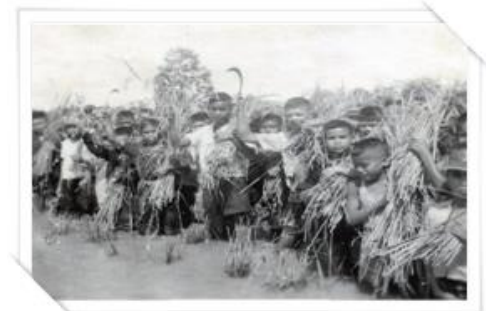
โรงเรียนประถมวิสามัญเกษตรกรรม ประจำอำเภอทุ่งสง