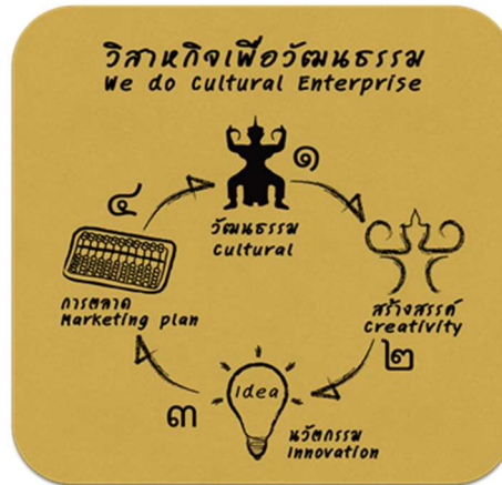
ภาพที่ 2 แสดงรูปแบบวิสาหกิจวัฒนธรรม (Cultural Enterprises)

อัตลักษณ์: มุ่งเน้นการอนุรักษ์ สืบสาน เผยแพร่ และพัฒนามรดกทางวัฒนธรรมเพื่อก่อให้เกิดเป็นมูลค่าภายใต้แนวทางวิสาหกิจวัฒนธรรม (Cultural Enterprises) ร่วมกับอาจารย์ บุคลากร นักศึกษา และชาวบ้านหรือผู้ที่มีส่วนเกี่ยวข้องกับภูมิปัญญา ทั้งในระดับท้องถิ่นและชุมชนเมือง